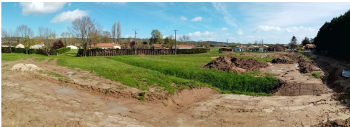
Lotissement Le Vignoble : les travaux de terrassement sont ralentis par les intempéries