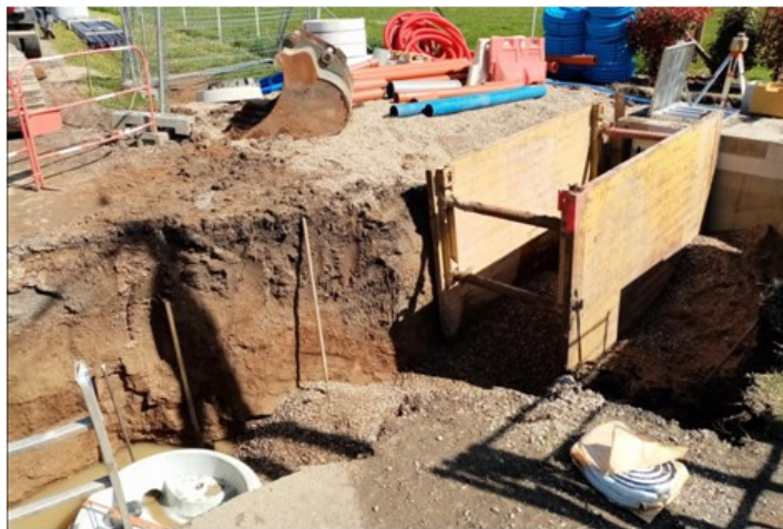
Assainissement : les réalisations en sont à plus de la moitié du projet global. ci-dessus : le collecteur et la pompe de relevage de la route du Gueynaie