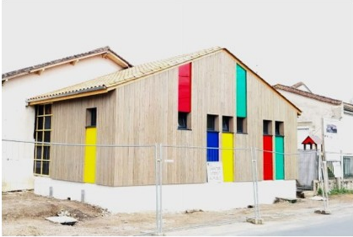
Bloc sanitaires : "Le Bloc sanitaires de l'école Marie-Claude Serres prend des couleurs. Il sera totalement opérationnel pour la rentrée 2024 !"