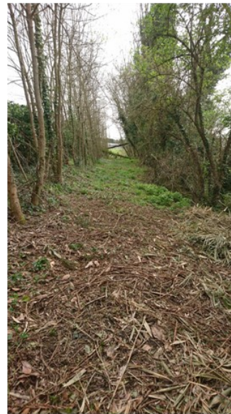
Nettoyage de la servitude de marchepied par les agents