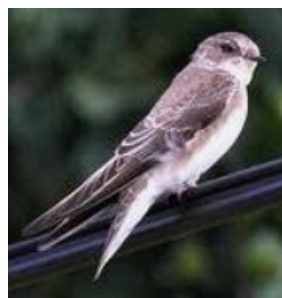
(Hirondelle de rivage)