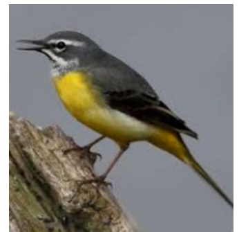
(bergeronnettes des ruisseaux)