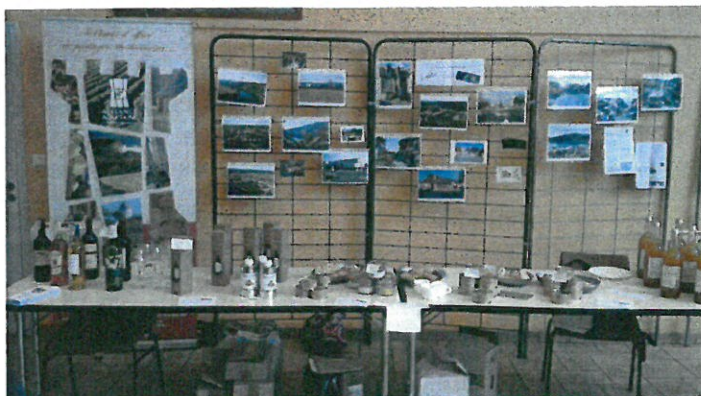
Stand de produits du Fleix à Langoat.

Langoat ? Un joli et dynamique petit village breton, comme vont le découvrir le petit groupe de 3 volontaires qui s'est rendu sur place, à l'invitation des langoatais, lors de leur fête annuelle du Pardon le 05 mai.