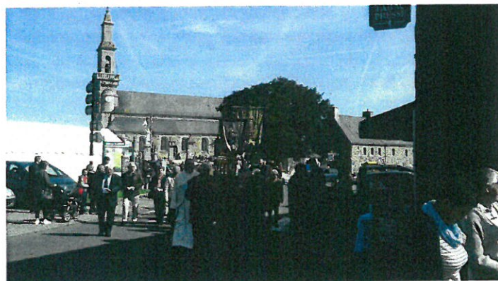
Le défilé du pardon à Langoat

Pour gérer ce jumelage, une association doit être constituée.